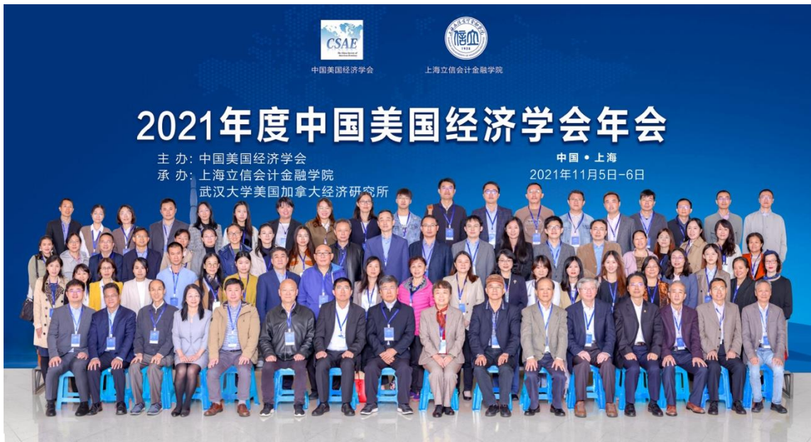
2021年11月5日至6日，成功举办2021年度中国美国经济学会年会