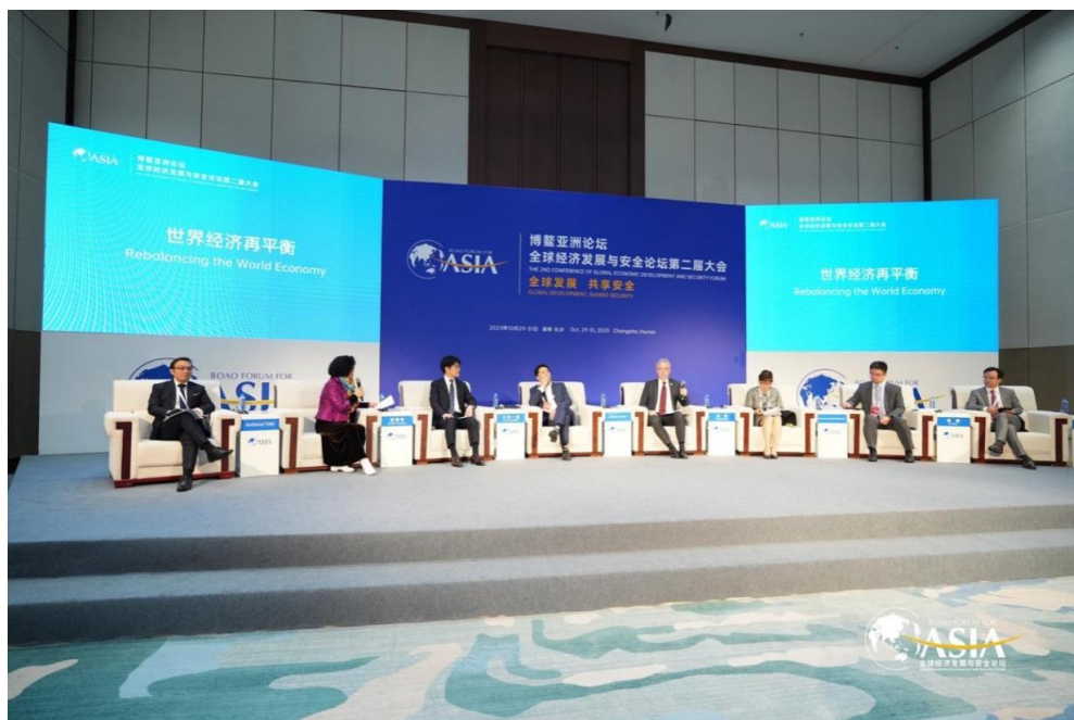
2023年10月，余振教授参加博鳌亚洲论坛：全球经济发展与安全论坛