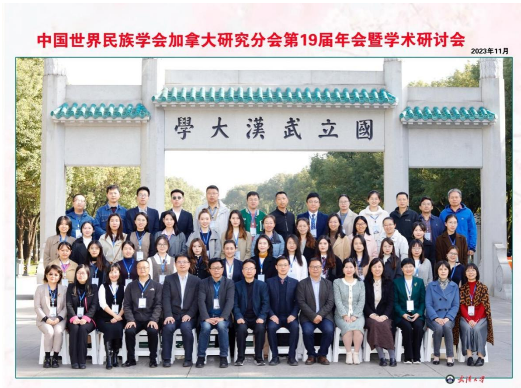
2023年11月，美加所代表参加中国世界民族学会加拿大研究分会第19届年会暨学术研讨会